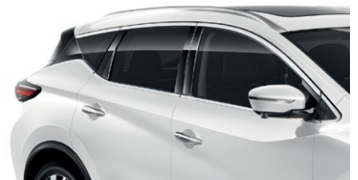
Белый перламутр — QAB