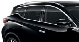
Черный — G41