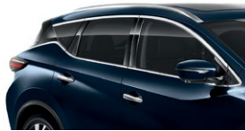
Темно-синий — RBG