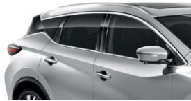
Серебристый — K23