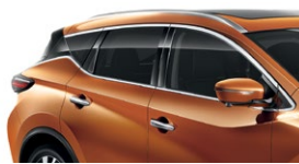
Оранжевый — EAW