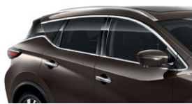
Серо-коричневый — CAM