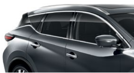
Темно-серый — KAD